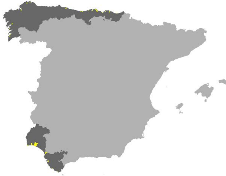
Figura I.18. Distribución del hábitat 1320 en la red Natura 2000 de las provincias de la Región Biogeográfica Atlántica de la Península Ibérica (Fuente: MMARM, 2009).