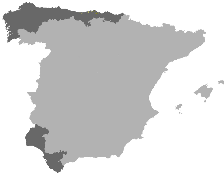
Figura I.2. Distribución del hábitat 1130 en la red Natura 2000 de las provincias de la Región Biogeográfica Atlántica de la Península Ibérica (Fuente: MMARM, 2009).